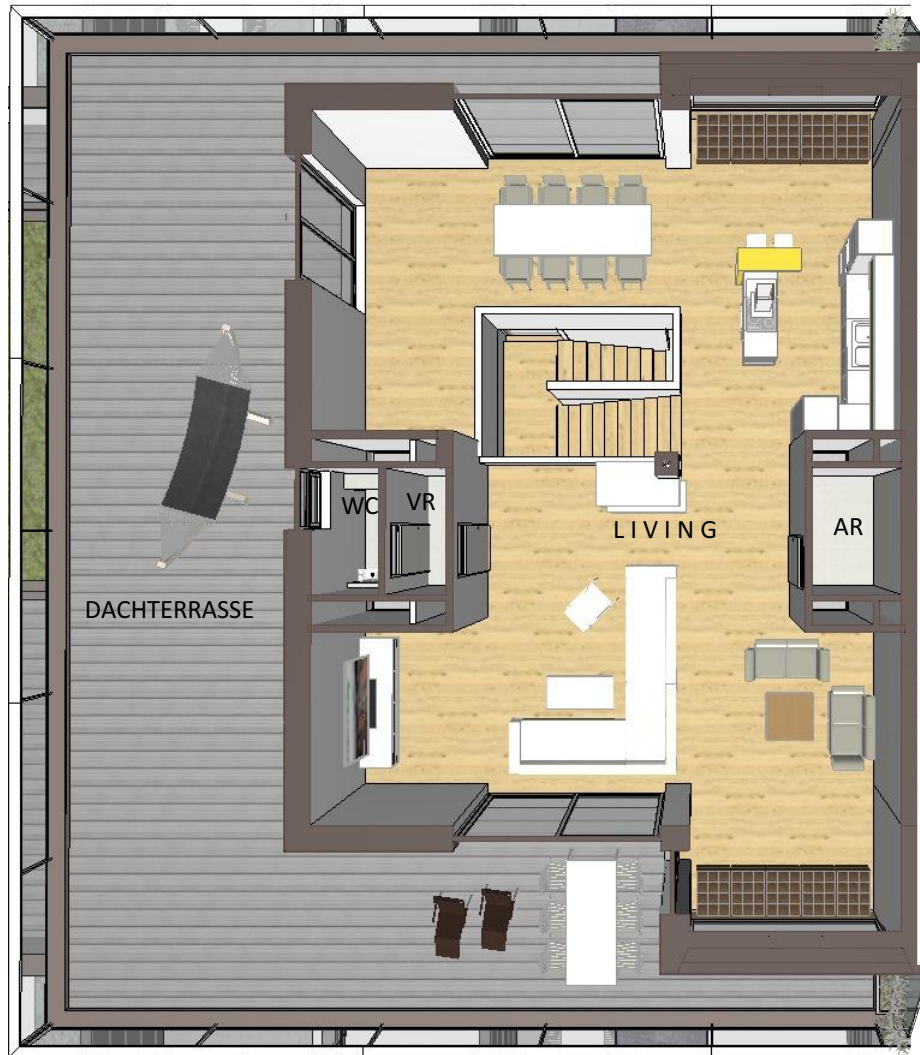
SYMBOLDARSTELLUNG DES WOHNUNGSGRUNDRISSSES 4.OBERGESCHOSS - WOHNEBENE (4.OG)