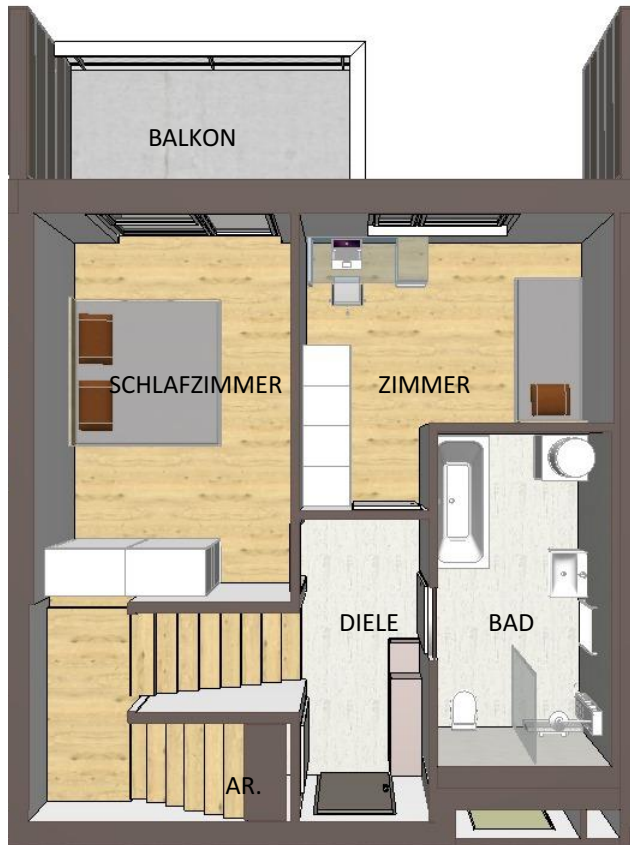
SYMBOLDARSTELLUNG DES WOHNUNGSGRUNDRISSSES 3.OBERGESCHOSS - SCHLAFEBENE (3.OG)